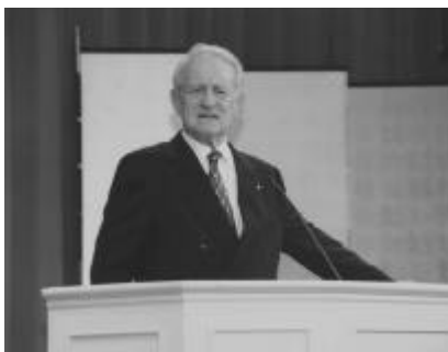
Johannes Rau im Deutschen Kulturzentrum

Am 1. und 2. Juli 2002 wurde vom Deutschen Akademischen Austauschdienst (DAAD) im Auftrag der Konzentrierten Aktion „Internationales Marketing für den Bildungs- und Forschungsstandort Deutschland“ im Kyôto Garden Palace (1. Juli) bzw. im Deutschen Kulturzentrum, Tôkyô (2. Juli) eine Veranstaltung mit dem Titel „Wissenschaft im Zeitalter der Internationalisierung – Perspektiven der deutsch-japanischen Zusammenarbeit“ abgehalten. Die Veranstaltung fand aus Anlaß der Eröffnung des vom DAAD geförderten „Zentrums für Deutschland- und Europastudien Komaba“ (DESK) an der Universität Tôkyô statt. Die Begrüßungsrede hielt Sasaki Takeshi, Präsident der Universität Tôkyô. Bundespräsident Johannes Rau hielt am 2. Juli im Deutschen Kulturzentrum Tôkyô eine Ansprache, der eine Podiumsdiskussion zum Thema „Forschungszusammenarbeit zwischen Deutschland und Japan: Der Beitrag der Wissenschaftler“ folgte. Im Foyer des Deutschen Kulturzentrums Tôkyô wurde vom 2. bis 5. Juli mit einem Informationsstand für den Wissenschafts- und Forschungsstandort Deutschland geworben.