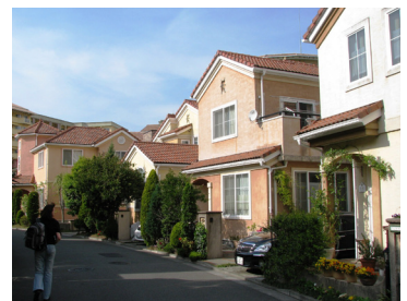
▶ Mark Springs, eine abgeschlossene Vorstadtsiedlung im US-amerikanischen Stil in Yokohama, fertiggestellt 2003.

Zwar erscheinen diese Hypothesen auf den ersten Blick plausibel, doch muss ihre Anwendbarkeit auf Japan erst nachgewiesen werden. Vor allem sollten die äußere Gestaltung und die soziale Zusammensetzung der neuen Wohnenklaven in Japan mit ähnlichen Entwicklungen in anderen Ländern verglichen werden. Darüber hinaus ist auf die Rolle und das Handeln der lokalen Akteure einzugehen. Die Einbeziehung des Falles Japan in die internationale Diskussion könnte zur weiteren Klärung der Frage beitragen, warum in fast allen Industriegesellschaften das Bedürfnis zugenommen hat, sich in abgeschlossene Siedlungen zurückzuziehen.